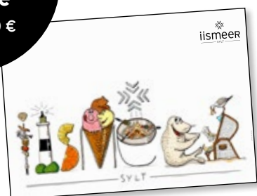
iismeer Malblock 8,00 €