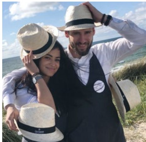
iismeer Sonnenhut 8,00 €