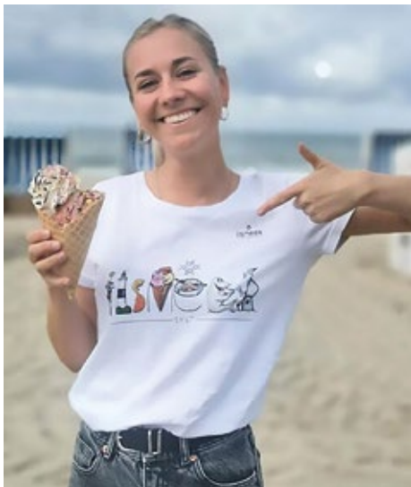
iismeer Shirt Oversized Look für Damen und Herren in L oder XL / 20,00 € Kids Gr. 122 oder Gr. 128 / 15,00 €