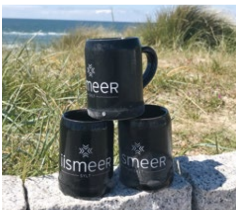
iismeer Bierkrug 0,25 ltr. 15,00 € 0,5 ltr. 20,00 €