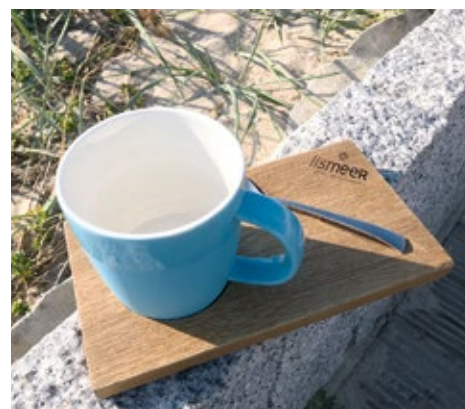
iismeer Kaffeebecher mit iismeer Holzbrett und Löffel Set 39,00 €