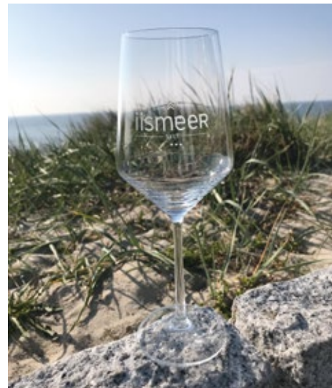
iismeer Weinglas Rot oder Weiß 12,00 €