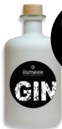
iismeer Gin limitierte Auflage 0,5l 59,00 €