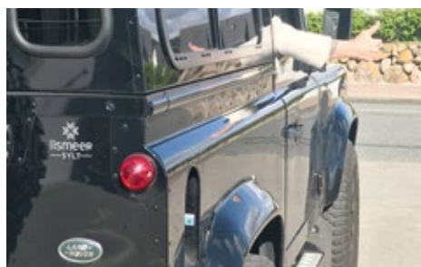
iismeer Autoaufkleber 9,5 cm x 9,5 cm, silber oder schwarz 2,50 €